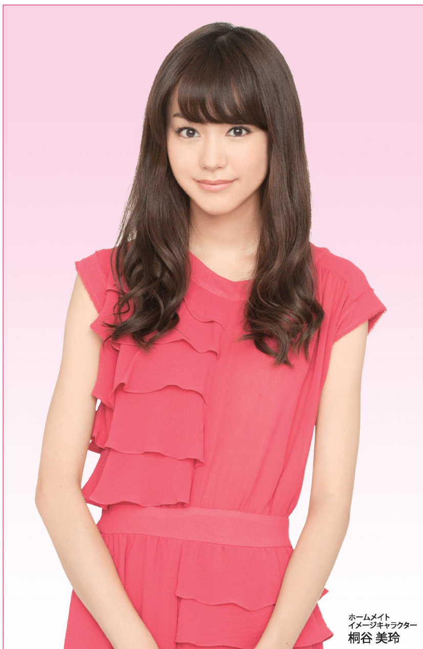
ホームメイト イメージキャラクター 桐谷美玲